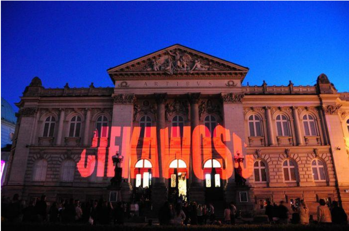
Foto 1. – La Galerie nationale d'art contemporain « Zachęta » - projection multimédia