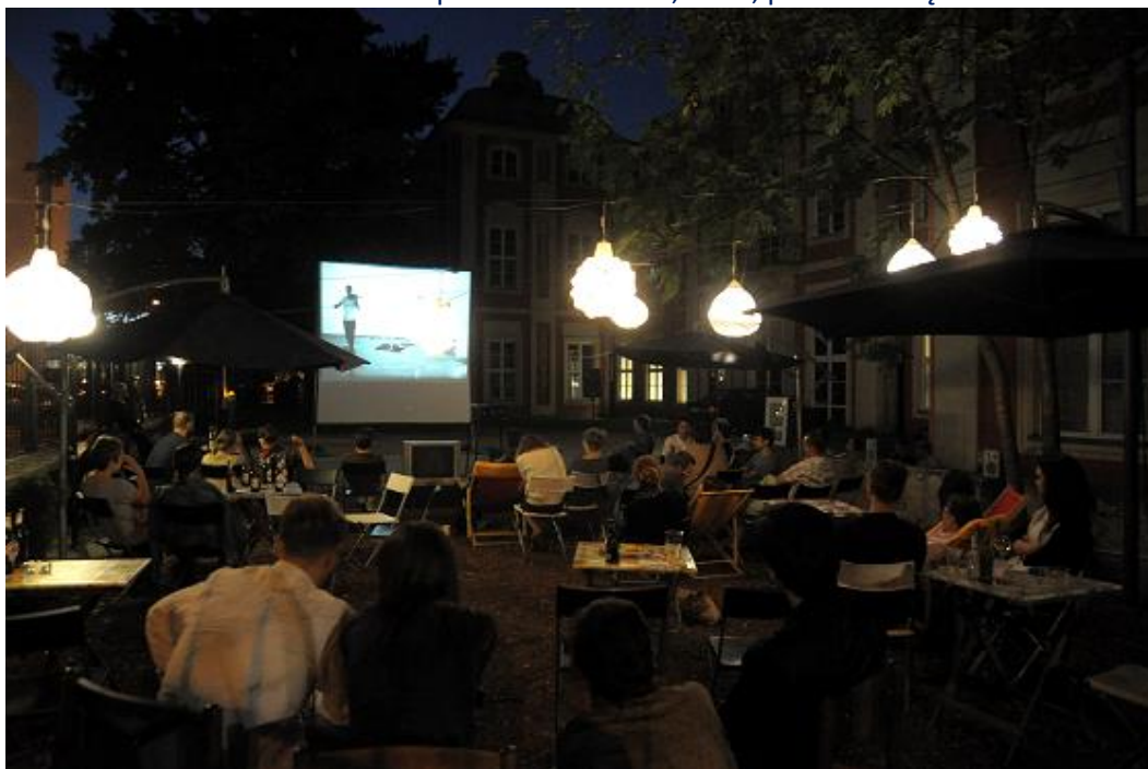
Foto 2. Cinéma en plein air - Eufemia, 2013

Les personnes associées à la Galerie reconnaissent les multiples besoins de leurs visiteurs, voilà pourquoi dans le cadre du projet Otwarta Zachęta (Zachęta ouverte) elles prennent des mesures diverses pour accroître la disponibilité des collections, des expositions et du bâtiment lui-même. L'un des éléments de cette politique est le lancement du portail OtwartaZacheta.pl qui met à disposition les œuvres de la collection, des matériaux pédagogiques, des catalogues d'expositions et certaines publications qui accompagnent expositions et films. La Galerie veut surmonter les obstacles économiques et sociaux qui empêchent l'accès à l'art grâce à des ateliers forains destinés à des élèves du secondaire hors des grands centres urbains. Depuis plusieurs années nous organisons un cycle de rencontres Voir/Avoir vu. L'art contemporain et les personnes âgées qui tentent de briser les stéréotypes sur l'art contemporain, d'encourager à poser des questions et de faire ses propres recherches.