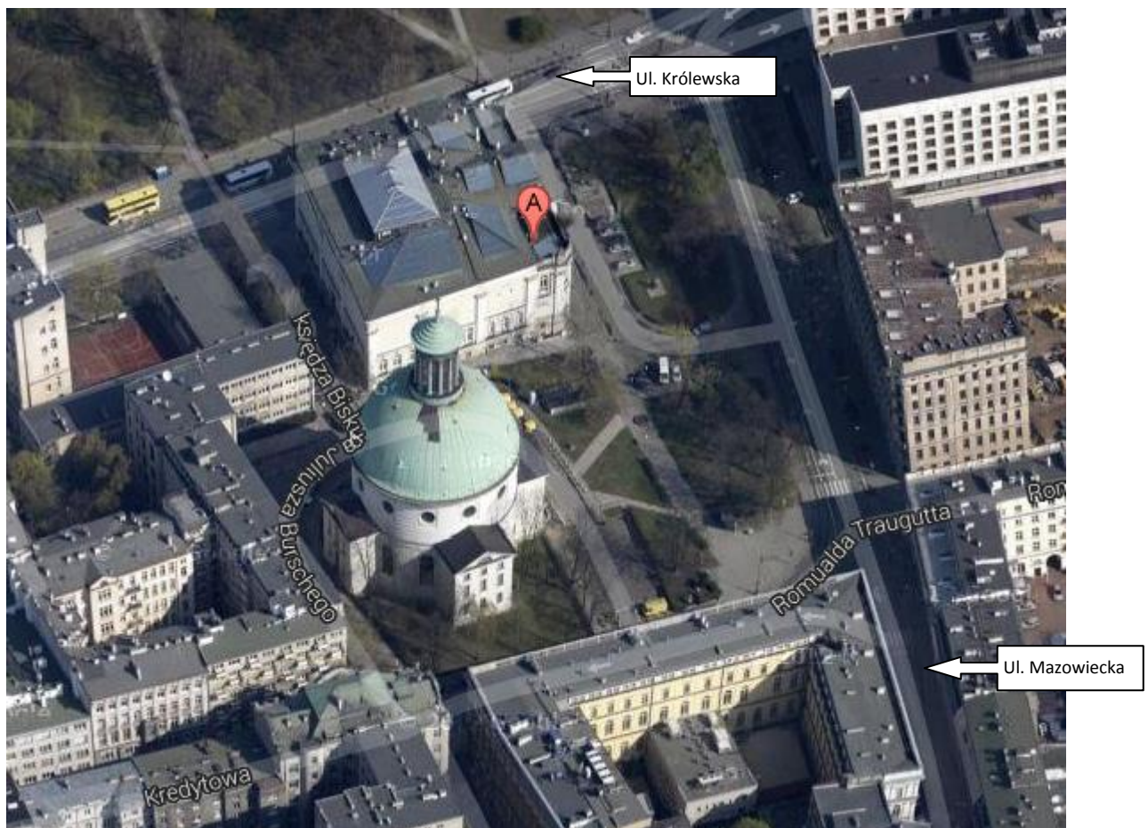
Photo 2. Vu d'ensemble de la place Małachowski

A – Zachęta. Galerie nationale d'art contemporain